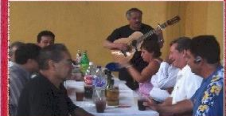
Información pág. 4