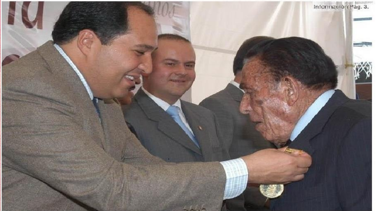
Información Pág. 3.