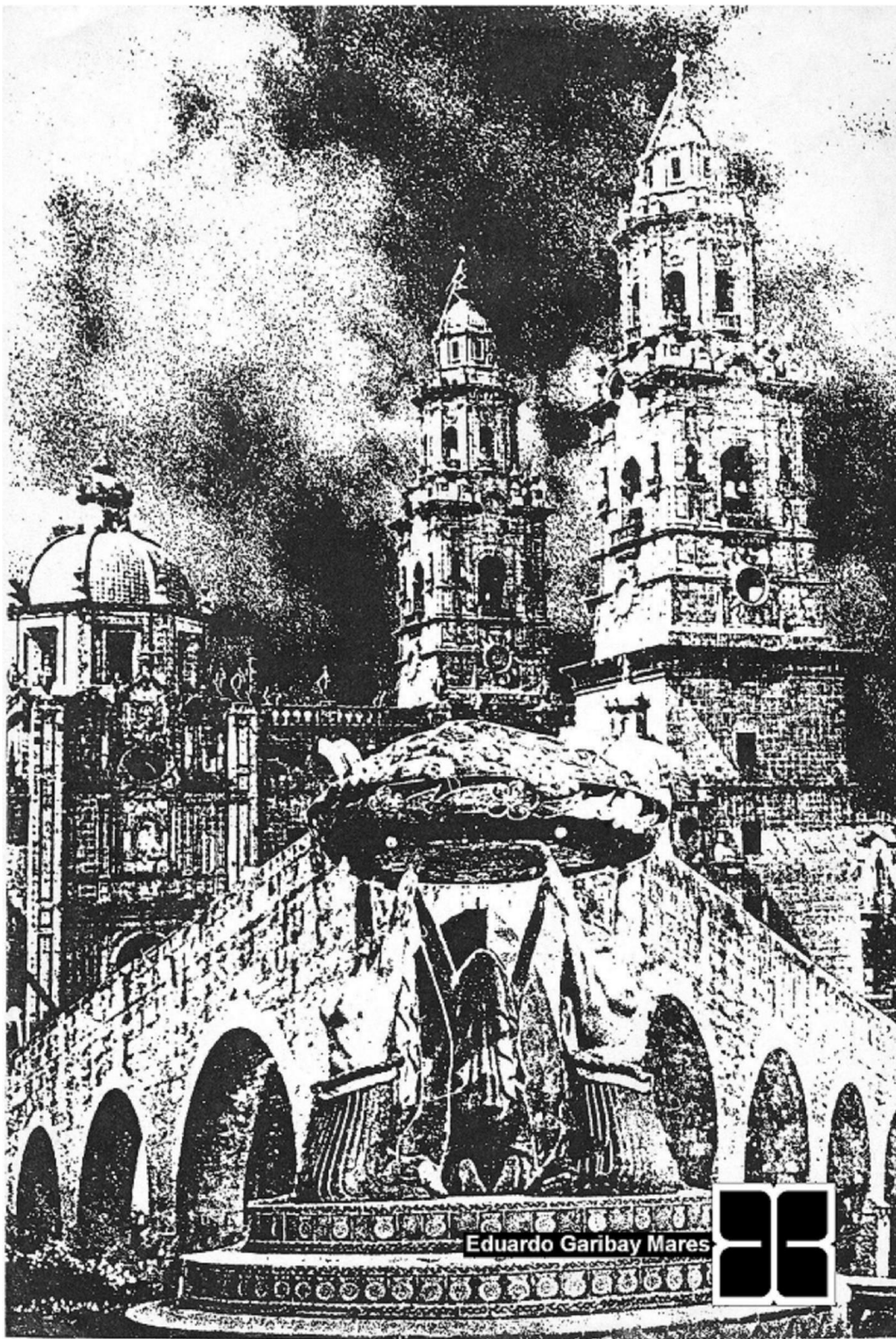
Catedral, Arcos del Acueducto, y Fuente de las Tarascas, de Morelia, capital de Michoacán.

Ubicada a 19° 42' de latitud norte y 101°11' de longitud