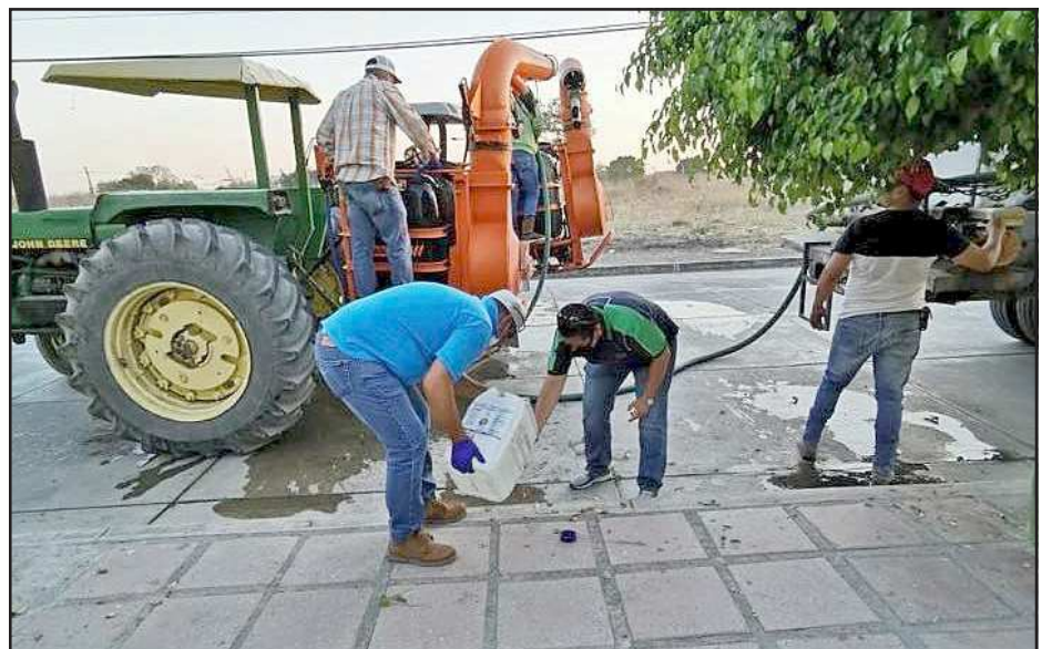
Yurécuaro, Mich.- Una vez más ¡gracias por hacer equipo!. Los agricultores en coordinación con el gobierno de Yurécuaro realizaron la segunda jornada de sanitización. Cada uno de nosotros hagamos nuestra parte. ¡Cuida tu salud y a tu familia!.