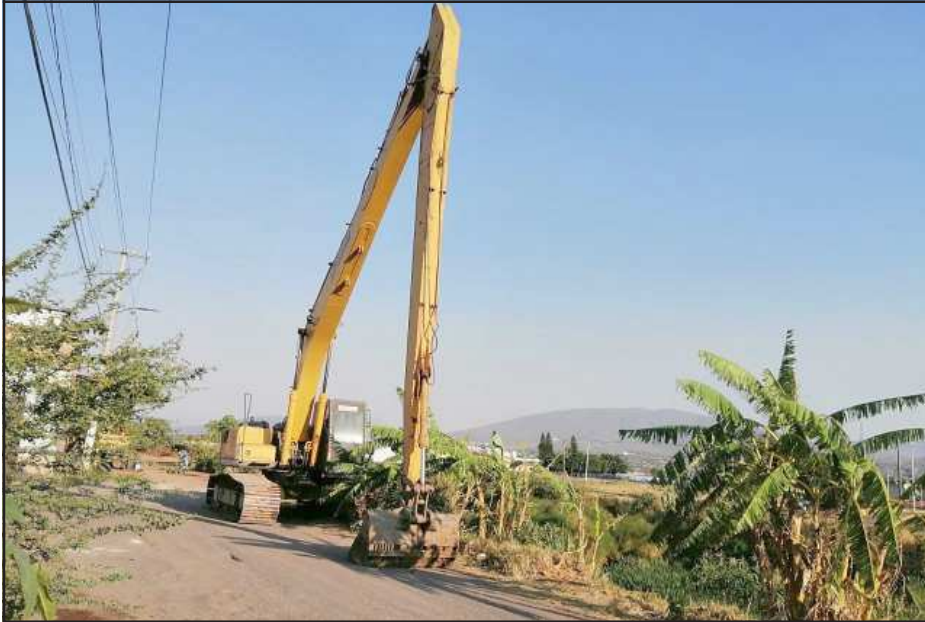
Edil zamorano dona combustible al Módulo de Riego para limpiar de canales en la región (Dren La Campana sin mantenimiento).