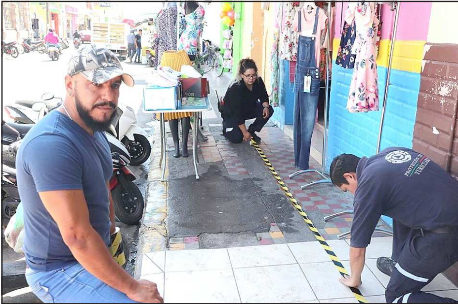
Yurécuaro, Mich.- Algunas de las acciones que realizan personal del Sistema Municipal de Protección Civil para hacer frente a esta emergencia epidemiológica del COVID-19. Tú que puedes quédate en casa, ellos no pueden.