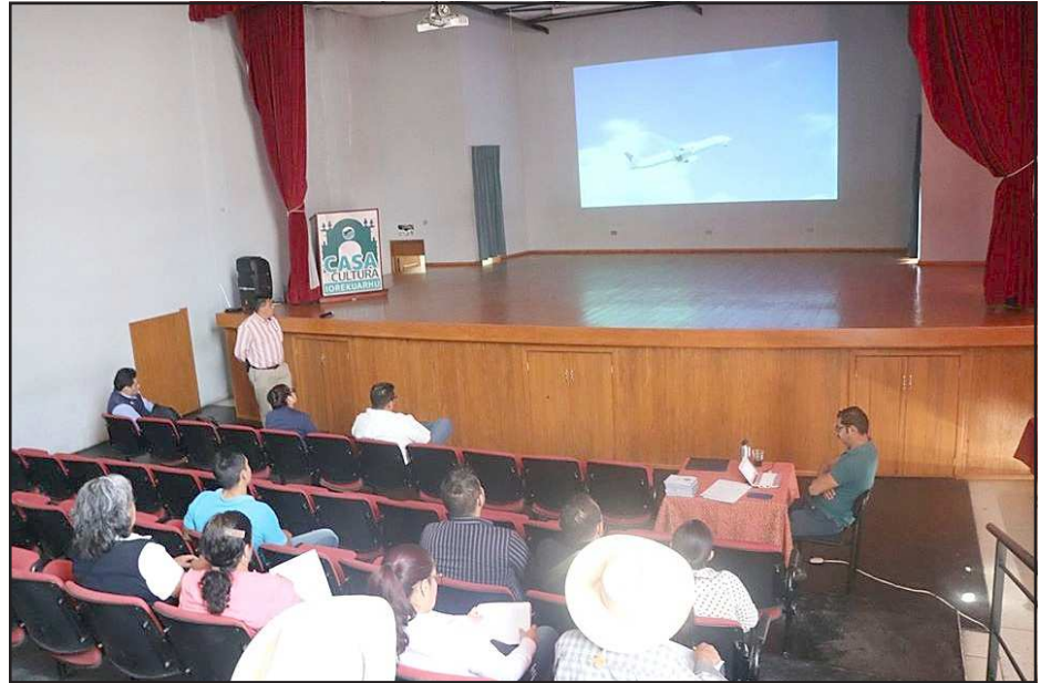
Yurécuaro, Mich.- Ante las contingencias epidemiológicas, se reunió el Comité de Salud Municipal y las autoridades sanitarias y de salud del Gobierno del Estado, con el fin de unificar criterios en la lucha contra el COVID-19.