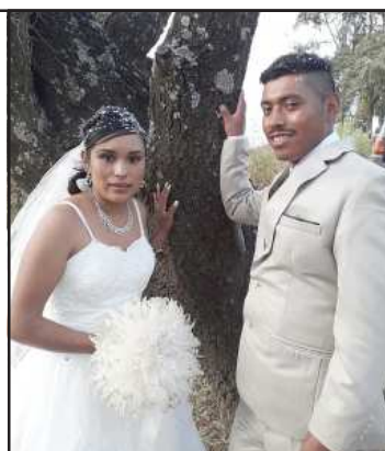
Tortolitos casados por las leyes civiles y religiosas.