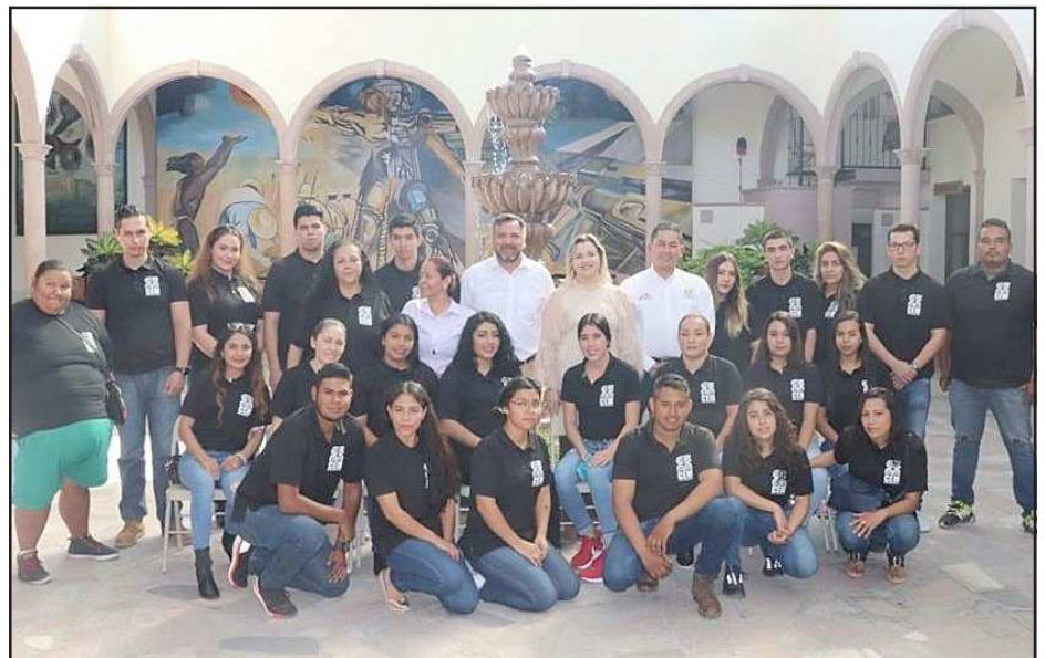
Yurécuaro, Mich.- Con una matrícula de 28 alumnos concluyó exitosamente el Primer Semestre de la Primera Generación del SEM Yurécuaro.