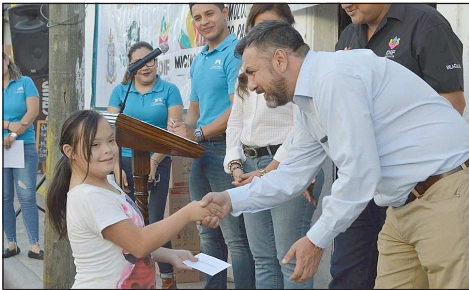
Yurécuaro, Mich.- Gracias a nuestros bienhechores se pudo realizar la segunda entrega de becas para discapacitados, aparatos motrices y cunas, apoyos a personas con cáncer, entrega de mobiliario y despensas a Jardines de Niños.