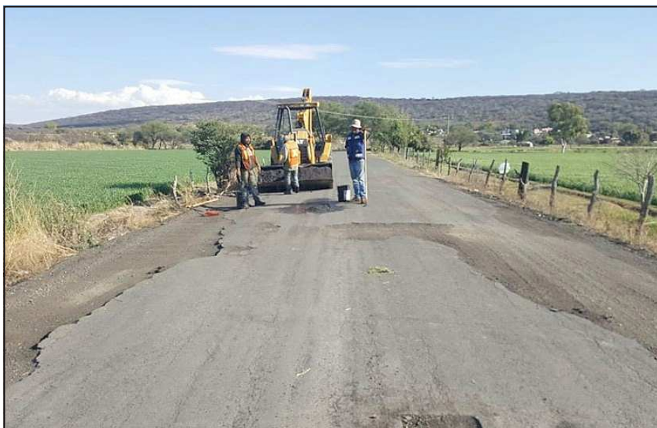
Yurécuaro, Mich.- La Dirección de Obras Públicas continúa trabajando en el mantenimiento integral de la carretera que conduce a la comunidad de El Refugio, uniendo con seguridad a nuestras comunidades. ¡En Yurécuaro vamos por buen camino!.