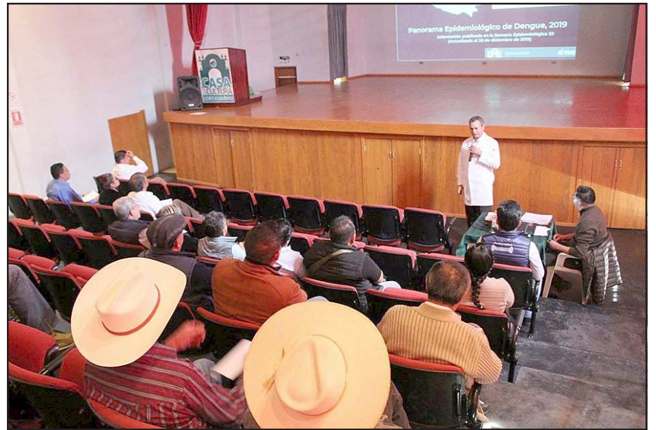
Yurécuaro, Mich.- Así se desarrolló la primer sesión del Consejo de Salud de este año en las instalaciones de la Casa de la Cultura.