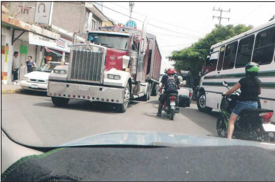
Problemas viales de tránsito, por autorizar la circulación de vehículos pesados en el primer cuadro de la ciudad.