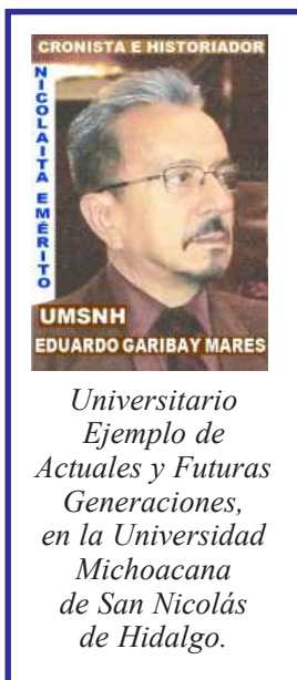
UNIVERSITARIO EJEMPLO DE ACTUALES Y FUTURAS GENERACIONES, EN LA UNIVERSIDAD MICHOCANA DE SAN NICOLÁS DE HIDALGO.

Participante en la conspiración de Querétaro para organizar el movimiento insurgente, a fin de independizar a México del imperio español, Josefa Ortiz de Domínguez hizo así posible el comienzo de la lucha de Independencia, cuando al enterarse que de las órdenes de aprehensión al descubrirse la conjura, avisó para que Miguel Hidalgo iniciase la guerra insurgente el 16 de septiembre de 1810. Nacida en Valladolid, hoy Morelia, Michoacán, la heroína del movimiento insurgente independentista murió en 1829 en la Ciudad de México.