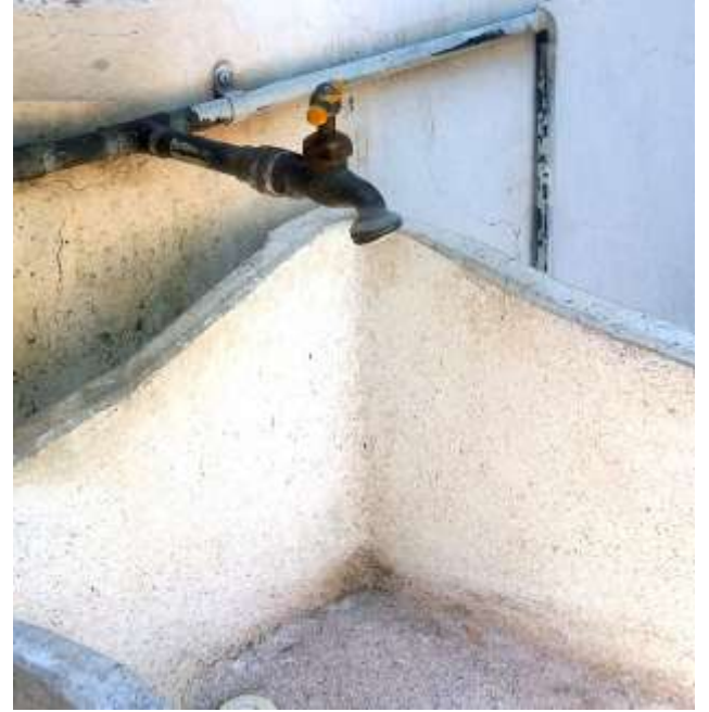
Sin gota de agua y seca la pila vacía.

Periodismo social por el que gubernativamente se vio con hosquedad a Torres y se le llenó de improperios, de los que la prensa asalariada agotó el vocabulario en la diatriba en su contra, por cometer el gran delito de defender a los morelianos de ese mal gravísimo de agua adulterada e insalubre, al esgrimir el arma de la razón y levantar la voz en favor de la gente perjudicada por aquella agua dañina y perjudicial, como lo manifestó el 13 de octubre de 1907 cuando también dijo quedar en espera de días mejores, e igual afirmó que sus artículos, vistos con desdén por sus adversarios, serían recogidos por la historia para juzgar a tales administraciones por el negocio del agua, puesto que, concluyó el periodista: el tribunal severo de la posteridad pronunciará su fallo que será inapelable.