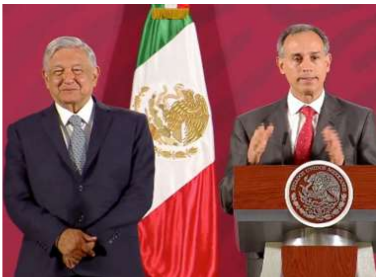
El Presidente de México Andrés Manuel López Obrador, y el Subsecretario de Prevención y Promoción de la Salud Dr. Hugo López-Gatell Ramírez, en la conferencia mañanera desde Palacio Nacional.