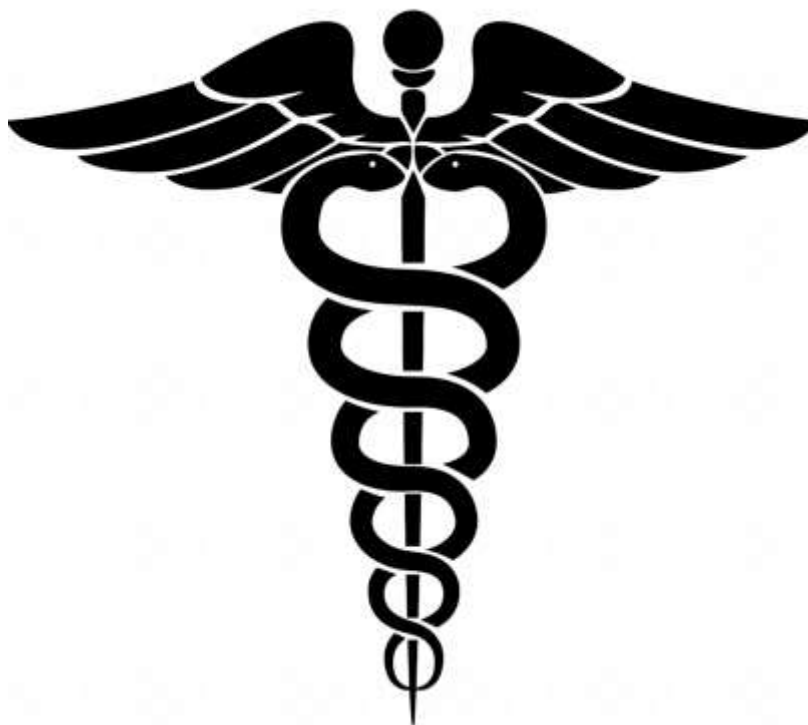
Símbolo de la Medicina

¡Quédate en tu casa! ¡Aíslate del riesgo de contagio, enfermedad y muerte! Pandemia viral