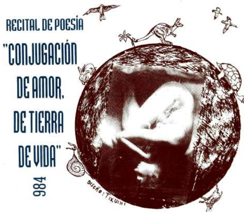
Recital de Poesía Conjugación de amor, de tierra, de vida . No. 984. Viernes Culturales, No. 984. Casa Natal de Morelos. Diseño/Tixuini