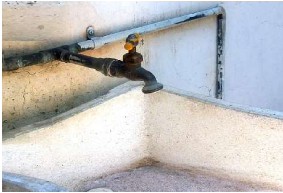
Sin gota de agua y seca la pila vacía.

Es el caso que para contar con una toma domiciliaria de agua potable, la persona financia un porcentaje de la tubería correspondiente no a los metros lineales del frente de su propiedad, como le ocurre al