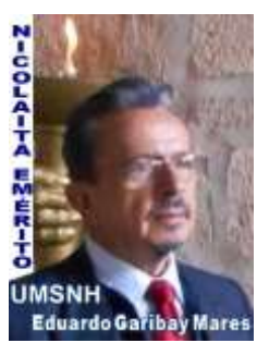
UNIVERSITARIO EJEMPLO DE ACTUALES Y FUTURAS GENERACIONES EN LA UNIVERSIDAD MICHOACANA DE SAN NICOLÁS DE HIDALGO. POR DESIGNACIÓN DE LA UMSNH

“...Se solemnice el 16 de septiembre como el día aniversario en que se levantó la voz de la independencia y nuestra santa libertad comenzó, pues ese día se abrieron los labios de la Nación