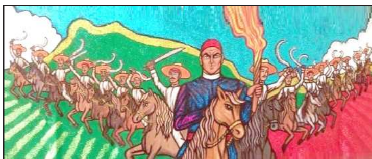
Morelos y su Contingente de 16 hombres de Nocupétaro el 31 de octubre de 1810. Mural itinerante de la Telesecundaria Héroes De Nocupétaro, en La Estancia Grande, del municipio de Nocupétaro, Michoacán.

Venegas, a través de un bando de gobierno, diez mil pesos de recompensa por las cabezas de Hidalgo, Allende y Aldama.