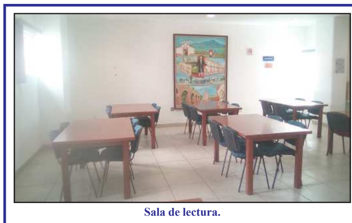
Sala de lectura.

Por ello es de esperar que se reconsidere una sede definitiva y adecuada por lo accesible, para que gente de todas las edades y de capacidades diferentes pueda ser usuaria del excelente servicio brindado.