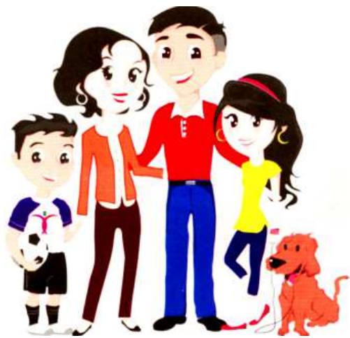
Día Mundial de la Población

ADULTOS MAYORES... Viene de la 1ª Pág. personas mayores de 60 años en 5 clubs, localizados en las colonias: Buenos Aires, Montebello, San José, La Planta y el Centro.