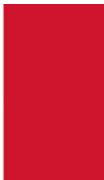
Bandera Nacional de los Estados Unidos Mexicanos, a partir del México revolucionario e institucional del siglo XX

Gobernación, a vigilar que todo se efectúe a cabalidad y que en esta función sean sus auxiliares todas las autoridades del país, lo cual, sin embargo, no se cumple debidamente.