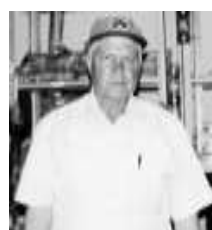
Talento poeta lírico.