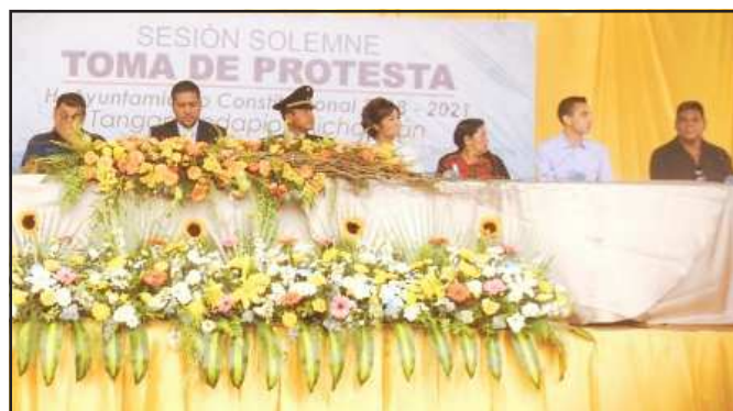
Toma de protesta, alcalde municipal de Tangamandapio, Mich.