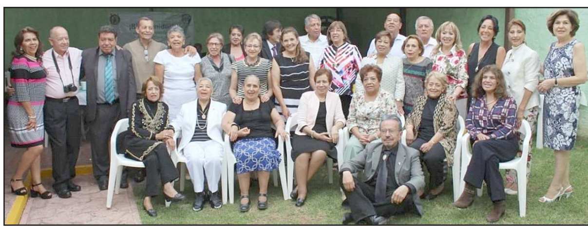
En el 45 Aniversario de la Generación 1969-1973.