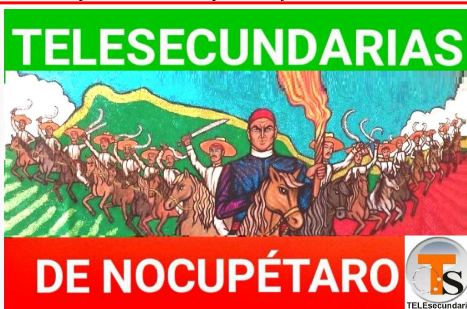
Estandarte para encabezar el desfile de las cinco Telesecundarias de Nocupétaro:

Fue así que ya integrado a la lucha insurgente, aquel histórico 31 de octubre Morelos comenzó la expansión de la guerra hacia el sur, que él emprendería por la independencia de la patria con su creciente Ejército Nacional Mexicano, iniciado con 25 hombres: 16 Héroes de Nocupétaro y 9 de Carácuaro, que fue punto de inicio y avance independentista a partir del cual Morelos, al