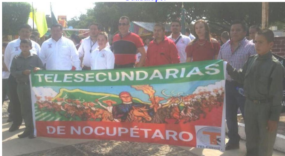
Maestros de las cinco Telesecundarias de Nocupétaro

Héroes de Nocupétaro, de la Estancia Grande; Lic. Benito Juárez, de Melchor Ocampo-San Antonio de las Huertas; Gral. Lázaro Cárdenas del Río, de Las Pilas; Flores Magón, de Santa Bárbara; y ESTV16 932, de la Hacienda de Guadalupe.