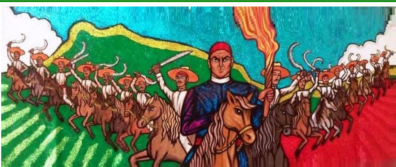
Morelos y su Contingente de 16 hombres de Nocupétaro el 31 de octubre de 1810, obra en acrílico sobre fieltro de 3 metros de ancho por 1 de alto.

Mural itinerante de la Telesecundaria Héroes De Nocupétaro, obra de Eduardo Garibay Mares Espinoza, en La Estancia Grande, del municipio de Nocupétaro, Michoacán