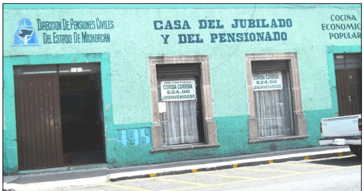
Casa de la Asociación Estatal de Jubilados y Pensionados en Michoacán, A. C., que aplica su lema Por una Verdadera Justicia Social al realizar actividades cotidianas tanto en bien de sus integrantes, como de la comunidad, en la calle 5 de Febrero 498, en el Centro Histórico de Morelia.

Como un ¡Ya basta! a la discriminación, en el histórico Michoacán insurgente se gestó en este patrio septiembre de 2017 el movimiento reivindicador de adultos mayores