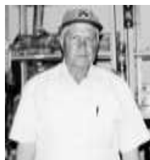
Talento poeta lírico.

El cuerpo se funde con el universo. El universo se funde en el sonido de la voz. El sonido se funde en toda luz que brilla. y la luz penetra en el secreto gozo infinito.