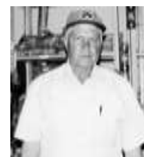
Talentoso poeta lírico.

El dinero y el poder corrompen a funcionarios para gobernar Combustibles fósiles por energía sustentable para evitar el calentamiento climático de la tierra