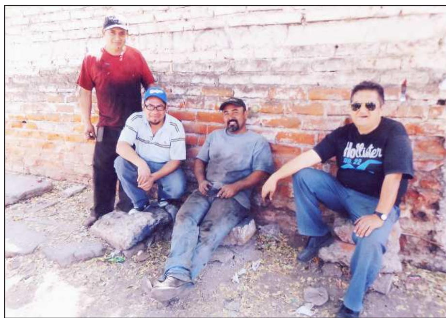
Entre amigos choferes, después de un agotador trabajo, ¡un buen descanso!.