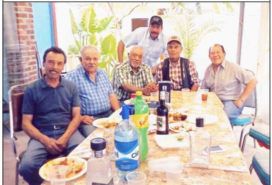
Los momentos más agradables de la vida son los que se conviven con los amigos.

una vida de calidad», enfatizó Cabrera Ramírez.