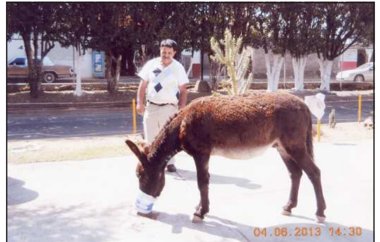
Ya es novedoso, ver a estos animalitos bíblicos, en vía de extinción, "que significa para siempre", en la bella ciudad de Pátzcuaro, Michoacán.

INSTALA GOBERNADOR ..... Viene de la Pág. 6 municipales de Cambio Climático; Promover la coordinación de acciones de las dependencias y entidades de la administración pública estatal en materia de cambio climático, entre otras.