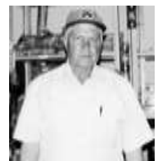
Talento poeta lírico.