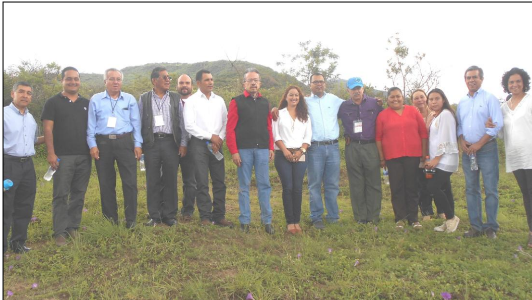
Consejeros de FAPERMEX con los presidentes de Tonaya, San Gabriel y Sayula, ante la vista panorámica del territorio de San Gabriel, lugar en el que se inspiró Juan Rulfo para su obra El llano en llamas .

La Ruta Cultural Juan Rulfo iniciará su programa intermunicipal el próximo año, como merecido homenaje por el aniversario 100 del nacimiento del distinguido escritor jalisciense, dado a luz el 17 de mayo de 1917 en la localidad de Apulco, perteneciente al municipio de Tuxcacuesco, aunque se le registró en Sayula, donde su acta de nacimiento se resguarda.