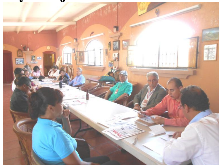
Lectura de Acta anterior en Asamblea AMIPAC-APREFOJAC. Junio 4 de 2016.