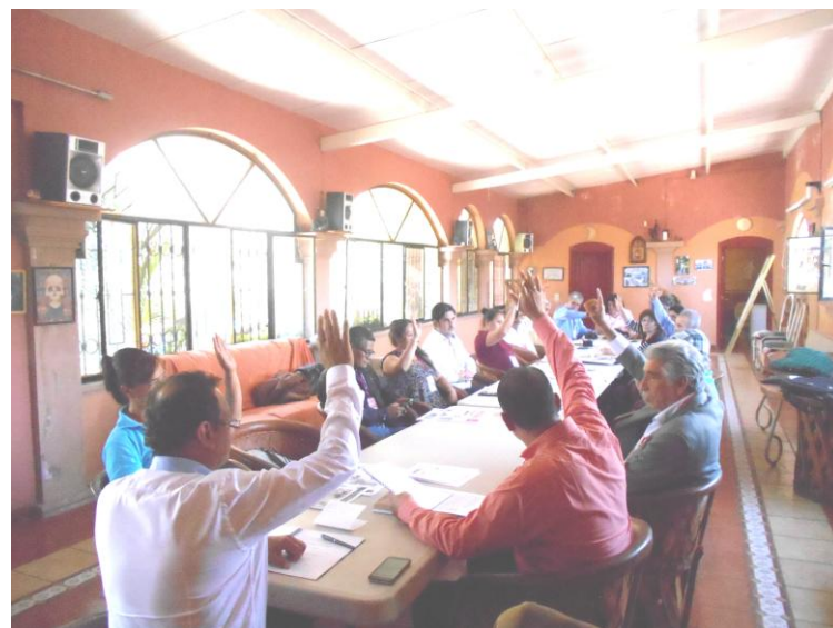
Votación en Asamblea AMIPAC-APREFOJAC. Junio 4 de 2016.