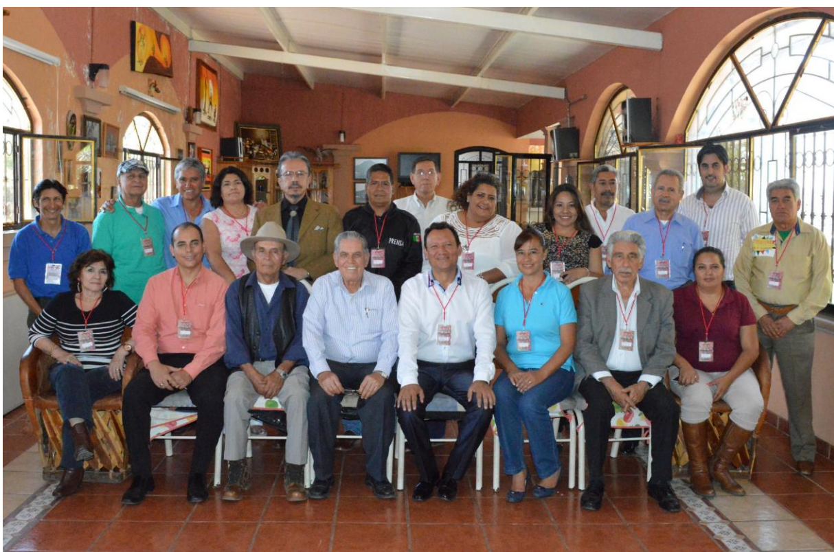
Asociados fraternos de AMIPAC y APREFOJAC. Junio 4 de 2016.

Unificación fraterna documentada con el acuerdo de afiliación a la Asociación Michoacana de Periodistas Asociación Civil, AMIPAC, y a la Federación de Asociaciones de Periodistas Mexicanos, FAPERMEX, al asimismo asentar en el Acta Constitutiva la decisión de sus socios fundadores de ingresar a la AMIPAC, con domicilio en Morelia, Michoacán, presidida entonces por su servidor, e igual afiliarse a la FAPERMEX, presidida en aquel tiempo por Roberto Piñón Olivas, con el objetivo de encauzar el ser y quehacer gremial periodístico de APREFOAC en la unificación fraterna en ámbitos estatal, nacional e internacional, ya que la afiliación con FAPERMEX a su vez hermana con el Club Primera Plana de la Ciudad de México y la Federación Latinoamericana de Periodistas, FELAP.