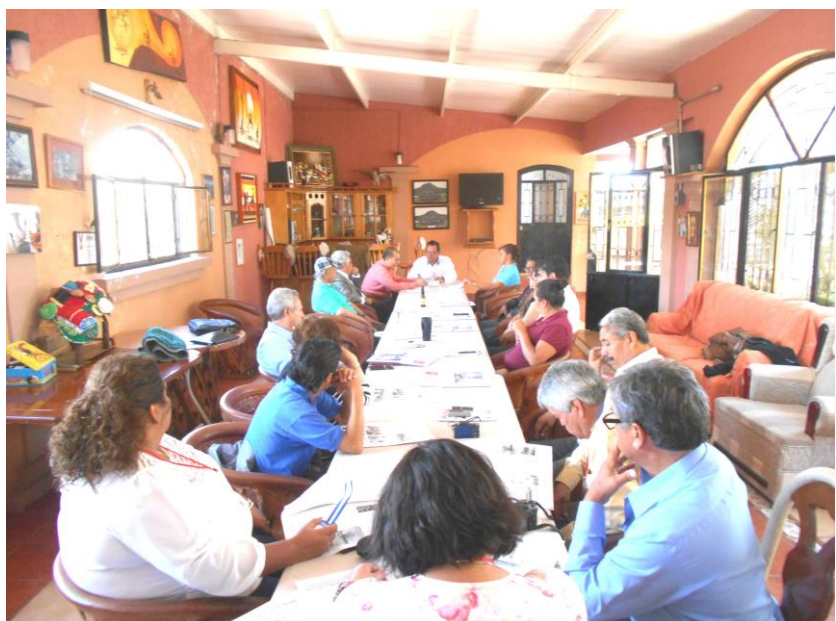
Desarrollo de Orden del Día en Asamblea AMIPAC-APREFOJAC. Junio 4 de 2016.