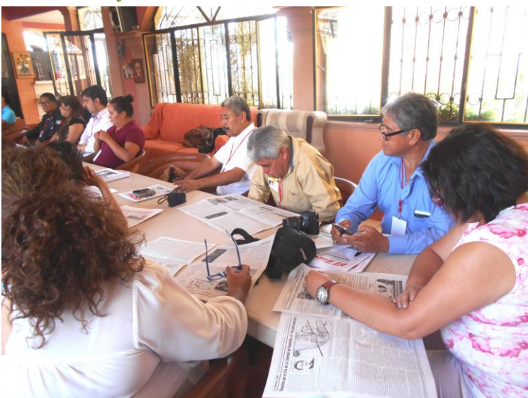
Receso concluida Asamblea AMIPAC-APREFOJAC. Junio 4 de 2016.