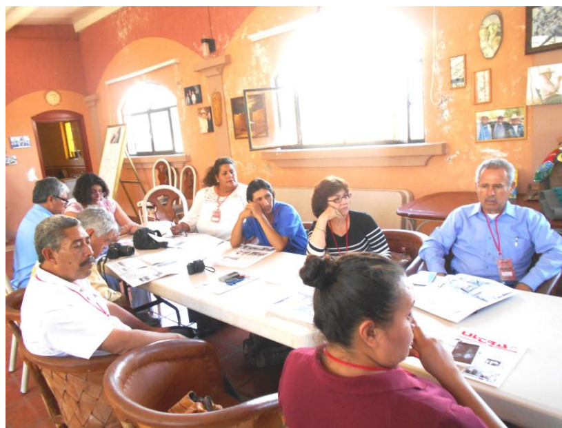
Asociados en Asamblea AMIPAC-APREFOJAC. Junio 4 de 2016.