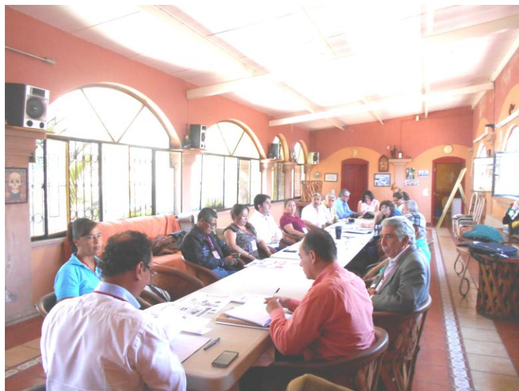
Informe del presidente en Asamblea AMIPAC-APREFOJAC. Junio 4 de 2016.