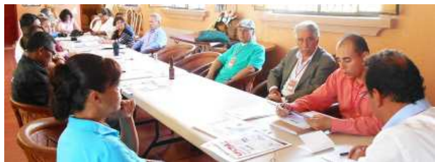
Lectura de Acta anterior y del Orden del Día, para su aprobación..