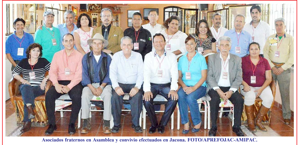
Asociados frateros en Asamblea y convivio efectuados en Jacona.

Unificación fraterna documentada con el acuerdo de