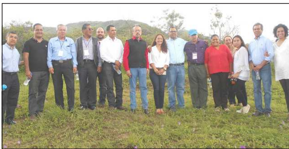
Consejeros de FAPERMEX con los presidentes de Tonaya, San Gabriel y Sayula, ante la vista panorámica del territorio de San Gabriel, lugar en el que se inspiró Juan Rulfo para su obra El llano en llamas .

La Ruta Cultural Juan Rulfo iniciará su programa intermunicipal el próximo año, como merecido homenaje por el aniversario 100 del nacimiento del distinguido escritor jalisciense, dado a luz el 17 de mayo de 1917 en la localidad de Apulco, perteneciente al municipio de Tuxcacuesco, aunque se le registró en Sayula, donde su acta de nacimiento se resguarda.