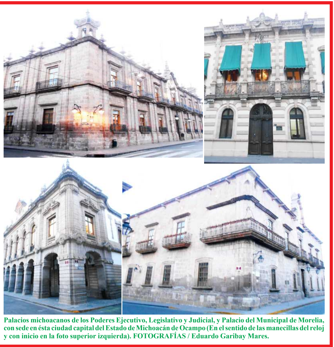
Palacios michoacanos de los Poderes Ejecutivo, Legislativo y Judicial, y Palacio del Municipal de Morelia, con sede en ésta ciudad capital del Estado de Michoacán de Ocampo (En el sentido de las manecillas del reloj y con inicio en la foto superior izquierda).

satisfacerlas, dado que, asimismo anotó Maquiavelo, en su riqueza nunca tienen bastante, puesto que su codicia crece con sus adquisiciones y por ello sus deseos son insaciables, motivo por el cual, agregó: “Si se anticipaban al partido que iba a triunfar, y le favorecían, era para sacar provecho. Destruían después al que ellos habían elevado, no bien les distribuía todas sus dádivas. Queriendo recibir siempre, arruinaban al nuevo triunfador, tan pronto cesaba de darles”.