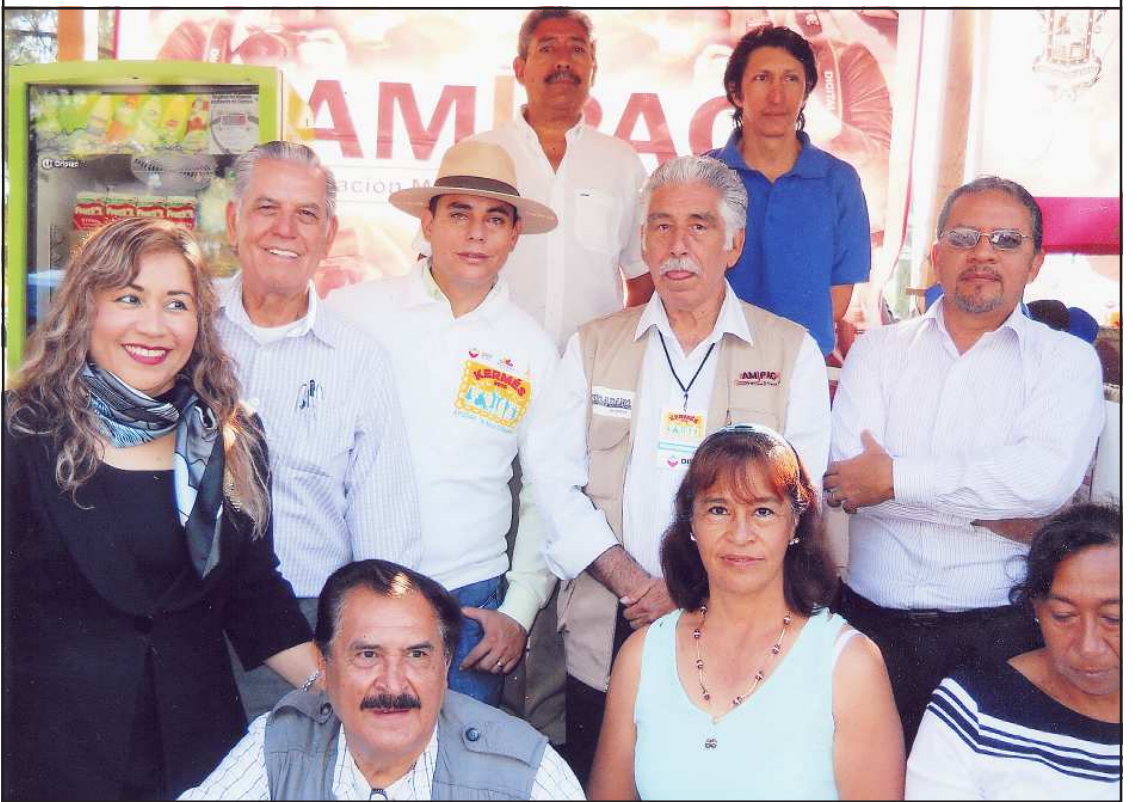
Foto tomada dentro de las reuniones de la Asociación Michoacana de Periodistas en Morelia