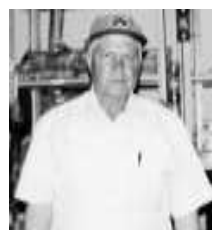
Talentoso poeta lírico.

Padres de familia: "Lleven a sus hijos al campo, porque cuando sean grandes sólo verán casas": Jacobo Zabłudovski