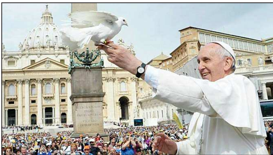
Papa Francisco y paloma (imagen referencial)

Que la fe salga a la calle significa que yo en mi lugar de trabajo, en mi familia, en las cosas que hago en la universidad, en el colegio, me muestro como cristiano.