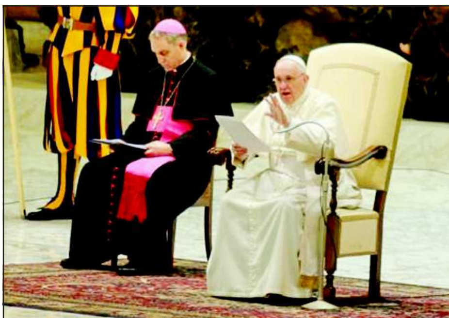
Papa Francisco en el Aula Pablo VI.

El Señor es “misericordioso”: esta palabra evoca una actitud de ternura como la de una madre con su hijo. De hecho, el término hebreo usado en la Biblia hace pensar a las vísceras o también en el vientre materno. Por eso, la imagen que sugiere es aquella de un Dios que se conmueve y se enternece por nosotros como una madre cuando toma en brazos a su niño, deseosa sólo