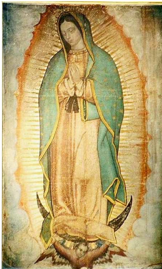
María Santísima de Guadalupe. Milagrosa imagen venerada en la Insigne y Nacional Basílica de Santa María de Guadalupe, del cerro del Tepeyac.

Así lo ejemplifica la tregua de amor guadalupano que cada año mitiga el creciente caos que afecta la vida de la República mexicana y su gente. Sosiego que ocurre desde la víspera del 12 de diciembre, cuando en todo poblado se culmina con peregrinaciones para venerar a la Madre de Dios, integradas por familias, vecinos, amistades, campesinos, obreros, comerciantes, empleados y empresarios, que acuden a festejar, ofrendar, pedir alivio a sus necesidades, agradecer dones recibidos y, principalmente, a ponerse al amparo de la Virgen de Guadalupe, madre de los mexicanos, reina de México y emperatriz de América. Día de fiesta nacional al que precede el cotidiano rezo del rosario, del 28 de octubre al 12 de diciembre, esto es, 46 rosarios que refieren al mismo número de estrellas que adornan el manto virginal de la advocación mexicana de María, madre de Jesús, el hijo de Dios hecho hombre.