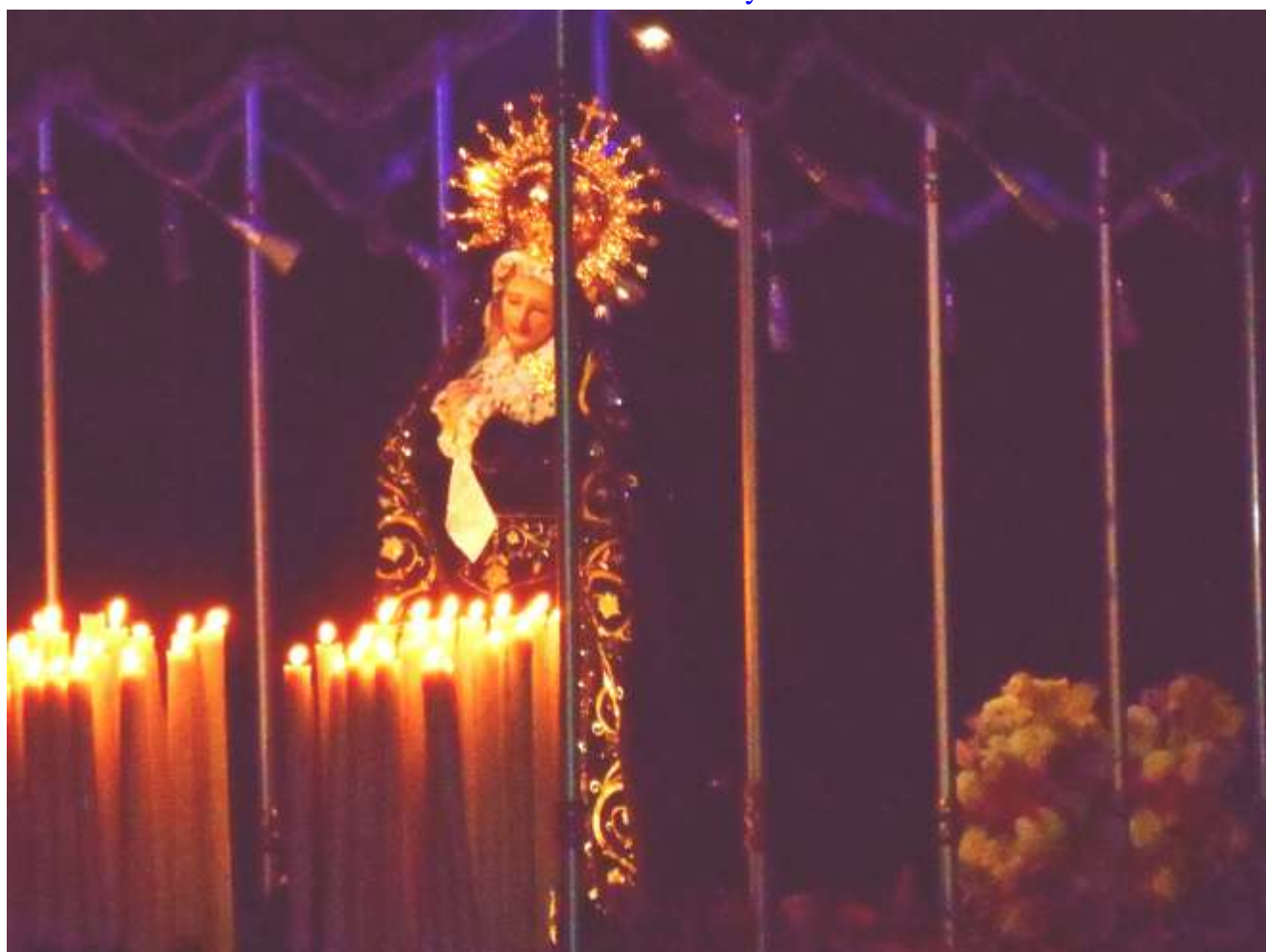
Virgen de los Dolores, en la Procesión del Silencio, en Morelia, Michoacán.