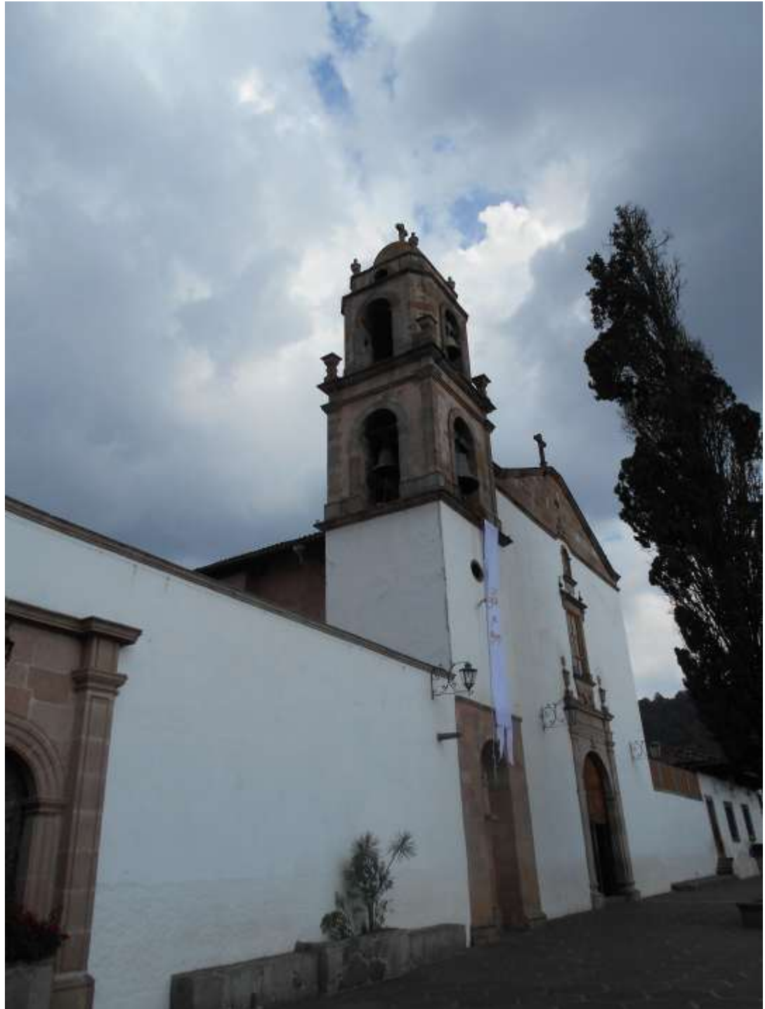
Iglesia Santa Clara de Asís, en Santa Clara del Cobre, Michoacán. Sábado 4 de abril de 2015.

Para la Iglesia Católica es en el Misterio Pascual que Dios Padre, por medio de Dios Hijo, y el Espíritu Santo intercesor, se inclina sobre cada hombre ofreciéndole la posibilidad de la redención del mal y la liberación por el bien. Una Pascua que igual Jesús celebró todos los años durante su vida terrena, según el ritual en vigor entre el pueblo judío, hasta el último año de su vida, en cuya postrer y anticipada Pascua instituyó la Eucaristía, en su Última Cena con los doce apóstoles, donde el hijo de Dios dio a la conmemoración tradicional de la liberación del pueblo judío un sentido nuevo y mucho más amplio, ya que no fue sólo a un pueblo ni a una sola nación, a quien liberó, sino a la humanidad, a la posibilitó una vida óptima y superior, cuando con su vida, obra y resurrección legó la vocación y misión cristiana de unir a todos los hombres, que jamás deben perder la esperanza en la victoria del bien sobre el mal.