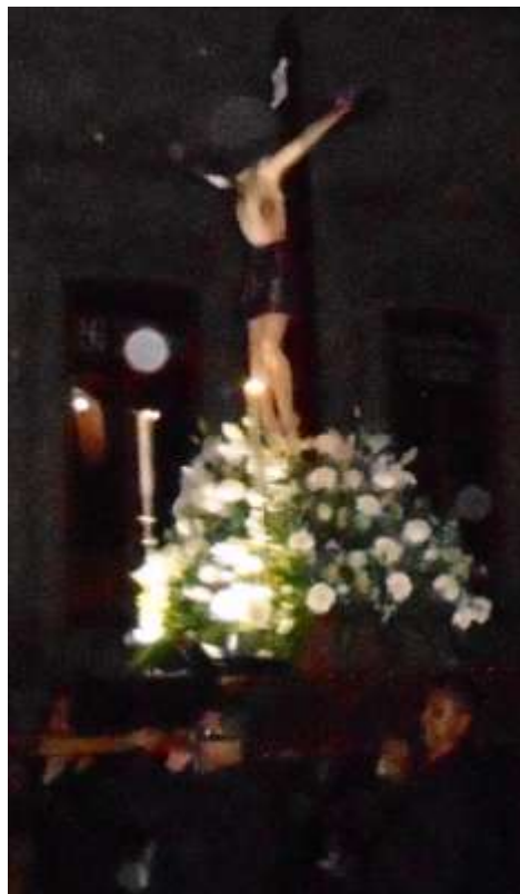
Jesucristo, en la Procesión del Silencio, en Morelia, Michoacán.

antigüedad por todo el pueblo de Israel, todavía es celebrada por los judíos tal como lo hicieron los hebreos por orden de Moisés, la víspera de su éxodo de Egipto, hace