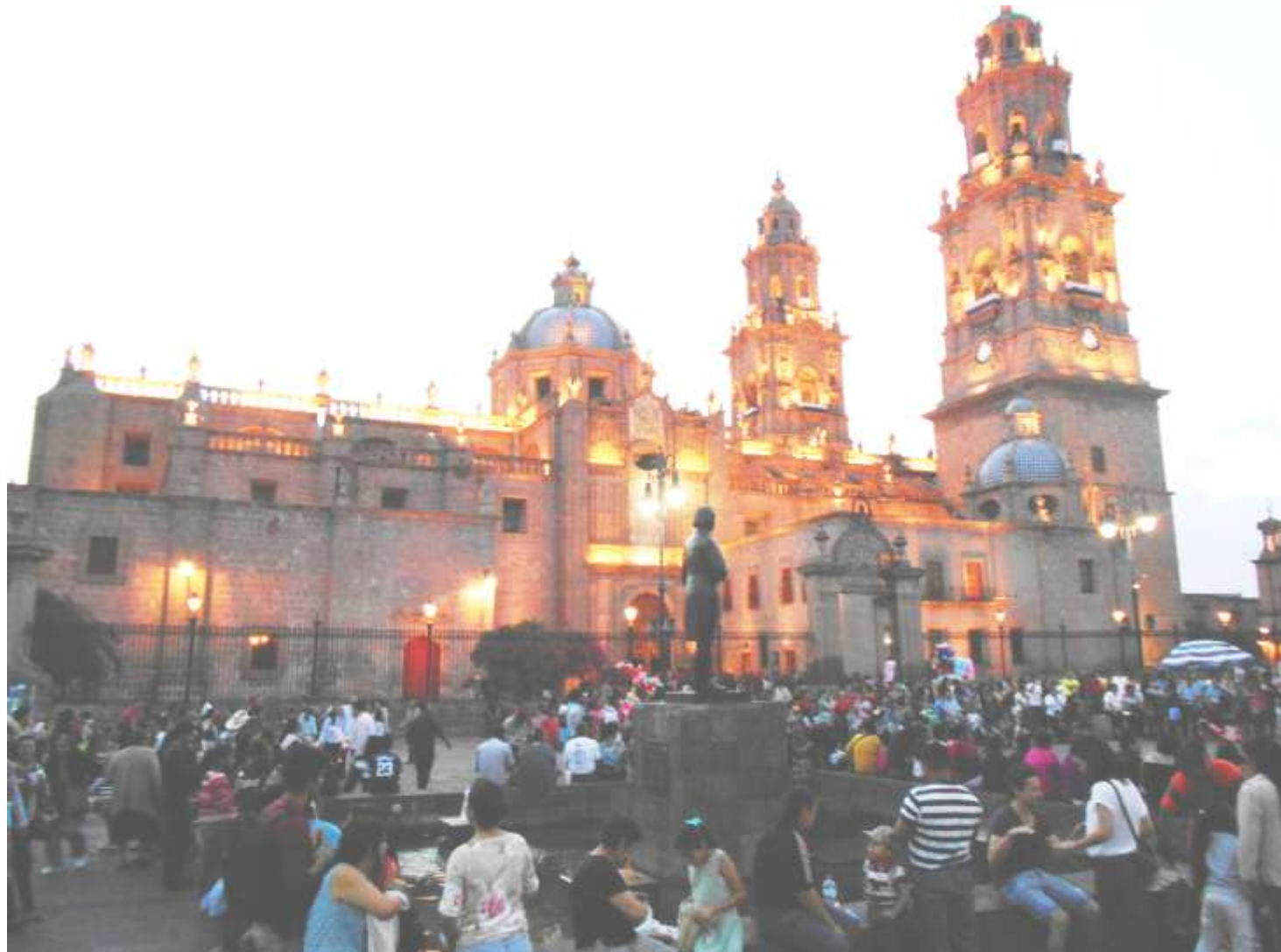
Pletórica la Catedral de fervor religioso en la anual Visita de los 7 Templos, en Morelia, Michoacán.

Y tres, el Triduo Pascual, que comprende: primero, el Viernes Santo, con su Viacrucis de flagelación, juicio, caminata al calvario y crucifixión, donde su muerte cubrió al mundo de tinieblas, y cuando luego de que la Virgen María, su madre dolorosa, recibió su cuerpo, fue sepultado por José de Arimatea; segundo, el Sábado Santo, de su estancia entre los muertos, y tercero, el Domingo de Pascua, de su resurrección, esto es, del pasar de la humillación a la gloria y de las tinieblas a la luz, a fin de llevar a la humanidad de la esclavitud al mal, física, mental y espiritualmente, a la liberación del bien.