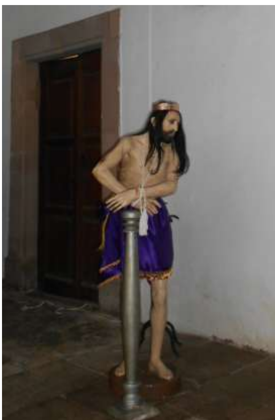
Jesús Nazareno. Iglesia Santa Clara de Asís, en Santa Clara del Cobre, Michoacán. Sábado 4 de abril de 2015.