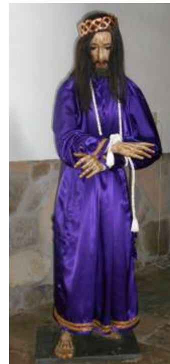
Jesús Nazareno. Templo Santa Clara de Asís, en Santa Clara del Cobre, JMichoacán. Sábado 4 de abril de 2015.