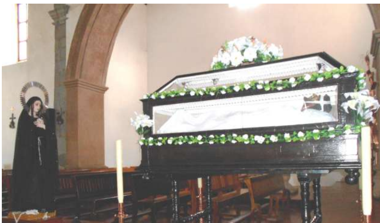
La Virgen de los Dolores y Jesús. Templo Santa Clara de Asís, en Santa Clara del Cobre, Michoacán. Sábado 4 de abril de 2015.