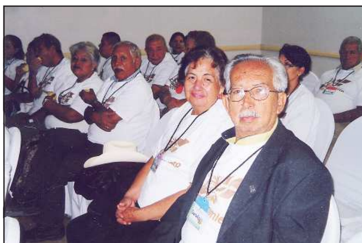
Promoviendo la prevención de enfermedades mentales y fortalecer las herramientas sociales y emocionales, para una vida en plenitud, para todos los derechohabientes de la tercera edad del IMSS.