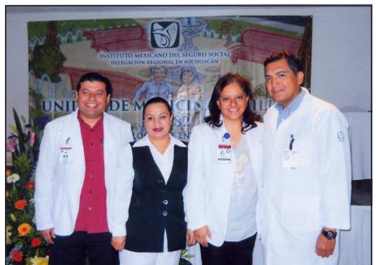
Galenos coordinadores de la salud pública regional del IMSS.