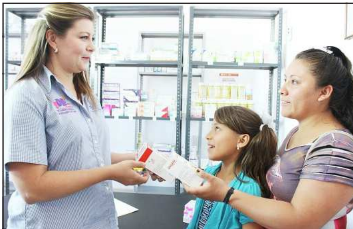
Zamora, Mich., 1 de Julio de 2015.- Uno de los beneficios que más ha contribuido con la salud de los zamoranos Pasa a la Pág. 5

Se pueden adquirir medicamentos a bajo costo.