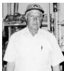
Talento poeta lírico.