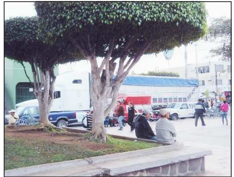
Riesgo peatonal en pleno centro de la ciudad, por la circulación de tráfico pesado.

En octubre se efectuará el acto cívico del Día de la Raza y el aniversario luctuoso de Lázaro Cárdenas; en noviembre el desfile de la Revolución Mexicana; y en diciembre el aniversario luctuoso de José María Morelos y Pavón.